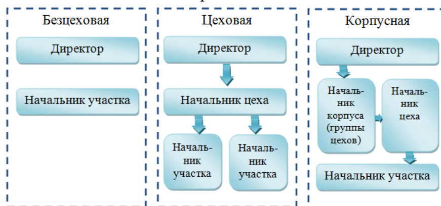
Схема зависимости управленческой структуры от специализации работы

Цифровые данные в таблицах пишутся строго по классам и разрядам чисел (единицы под единицами, десятки под десятками и т.д.).