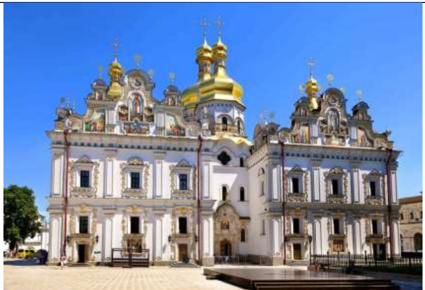
Киево- Печерская лавра