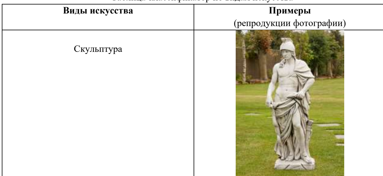
Таблица-классификатор по жанрам изобразительного искусства