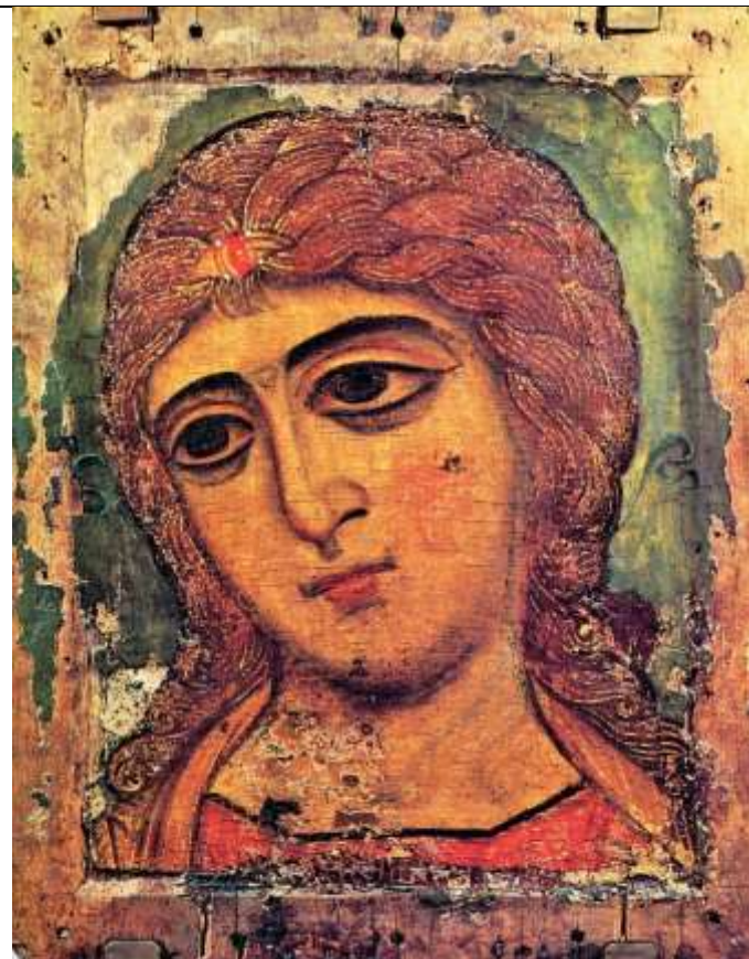
Икона "Ангел Златые Власы".