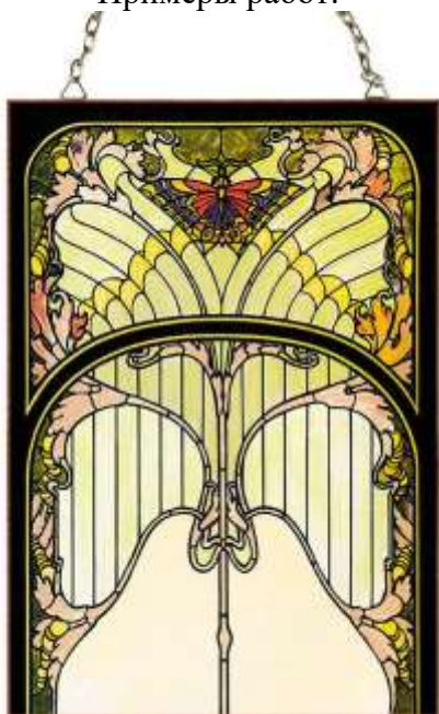
Витраж в стиле Ар нуво.