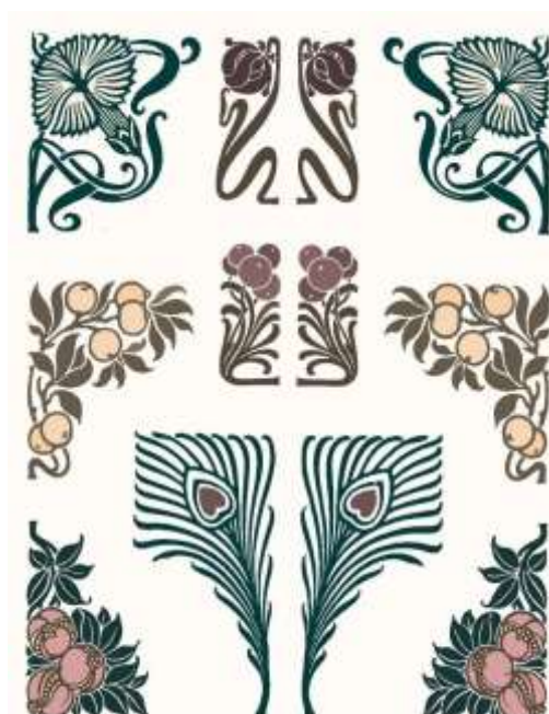
Элементы декора тканей, обоев в стиле модерн